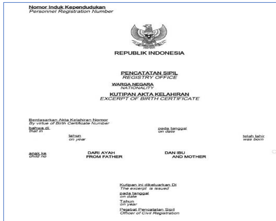
Formulir 5 - Kutipan akta kelahiran anak yang dilahirkan dalam atau sebagai akibat perkawinan yang sah.