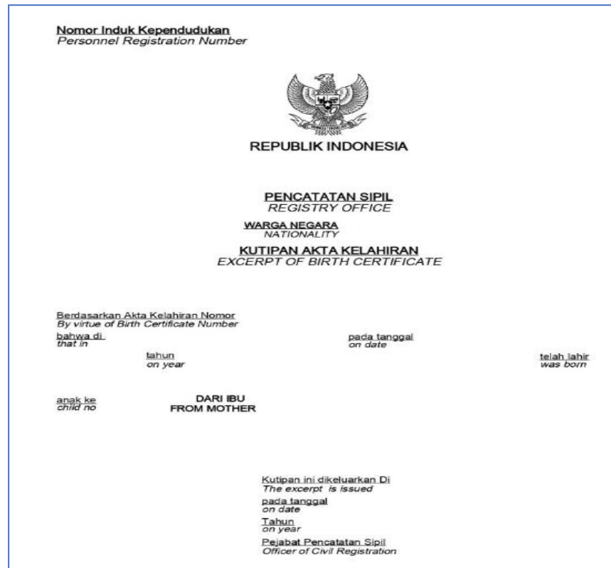
Formulir 7 – Kutipan akta kelahiran anak seorang ibu