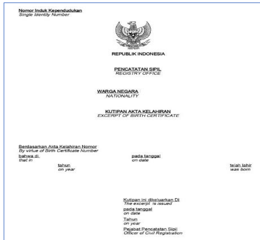
Formulir 8 - kutipan akta kelahiran anak yang tidak diketahui asal usulnya atau keberadaan orang tuanya