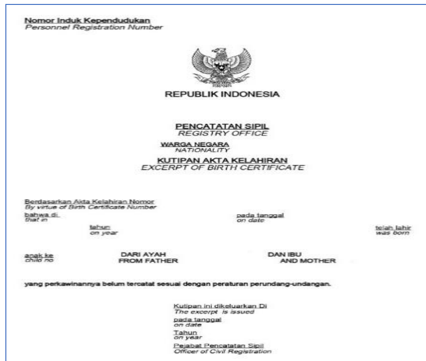
Formulir 6 - Kutipan akta kelahiran anak dari ayah dan Ibu, dengan frasa.