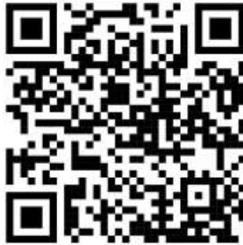
QR Code SIPEDUK TTS